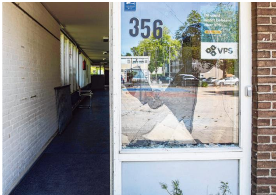
De gebroken ruit naast de deur wordt maandenlang niet gerepareerd.

Zo'n zestien kinderen, ze voetballen eerst liever maar als het gaat regenen komen ze binnen. Er staan tafels klaar met losse planken erop voor tegen de hut, die worden roze, lila, blauw, geel, rood. Stippen, golfstrepen, hartjes. Vier jongens schrijven met stift hun namen erop. De meisjes 'S + M + S = BFF'. „Ik ben blij”, schrijft een meisje van zes.