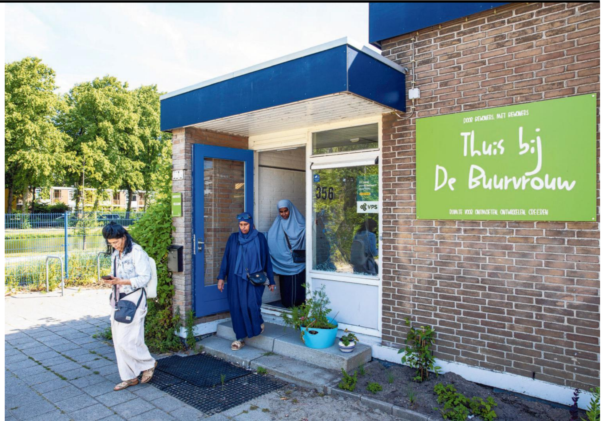
Het buurthuis is gevestigd in het voormalige kleutergebouw van een school.